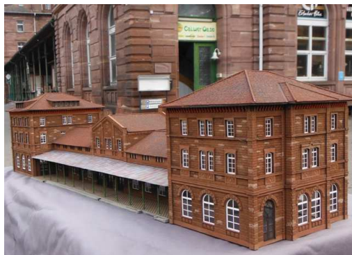
Das Foto zeigt das allererste Muster noch ohne Zurrüsteile. Im Hintergrund das Original.

Und endlich ist auch das erste Muster des Bahnhofsmodell fertiggestellt