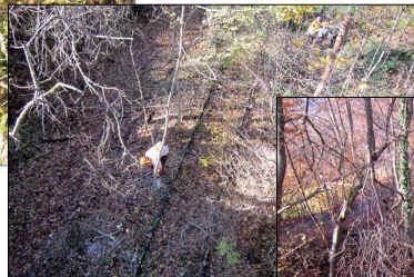
Nach einiger Zeit

Frei geschnitten sind nun vom Verein Calw-ZOB bis Heumaden „Brücke“ und Ortsgebiet Althengstett