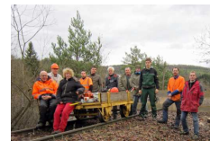
Etappenziel Heumaden Brücke

Frei geschnitten sind nun vom Verein Calw-ZOB bis Heumaden „Brücke“ und Ortsgebiet Althengstett