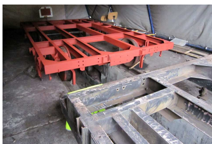
Die SKL Anhänger werden renoviert