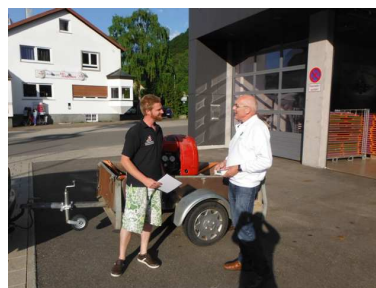
Ein Motor für die Bahnmeister Draisine